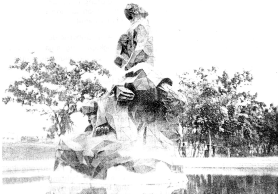
BANTAYOG SA TATLONG PARING MARTIR – SINA PADRE JOSE BURGOS, MARIANO GOMEZ AT JACINTO ZAMORA.

laga nuong 1890 na magtatag ng Masoneriyang Pilipino. Si Luna, na naghanda ng mga plano, ay hindi nakasama kung kaya si Serrano-Laktaw ay mag-isang umuwi upang magorganisa ng lohiya sa Pilipinas.